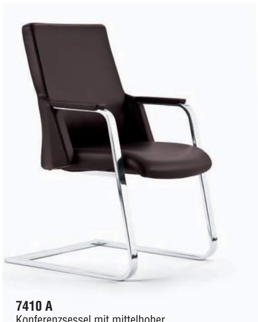
7410 A Konferenzsessel mit mittelhoher Rückenlehne, Freischwingergestell mit Vierkantrohr in Chrom.

Alternative Bezugsstoffe: Semianilinleder, Microfaser, Schurwolle.